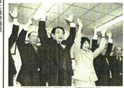
福岡県知事選挙。麻生、大分、佐賀の3県で麻生氏が再選。麻生氏は福岡県知事として3期連続で再選された。